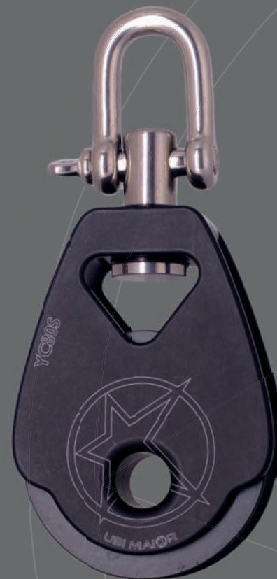
YC80S (new design 2017)