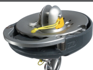
Tourelle avec mousqueton