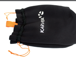
Sac de rangement