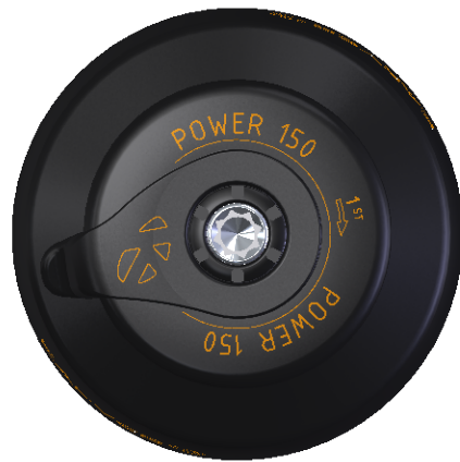
ENTREE CORDAGE LINE ENTRY